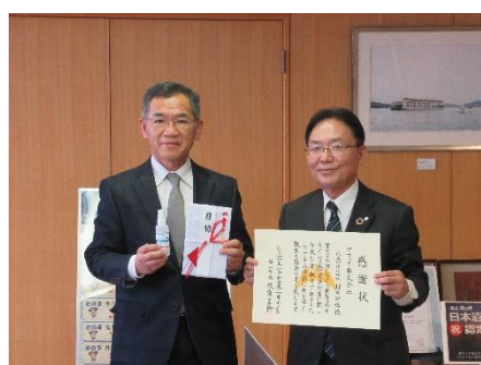
枝廣福山市長より感謝状を頂きました