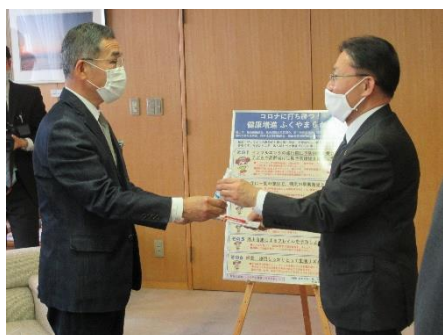
福山市役所本庁舎にて Etak®セーフティーコート®を寄贈

当社は、一日も早く新型コロナウイルスの感染拡大が終息し、復興に向けた活動が進展することを祈念しております。